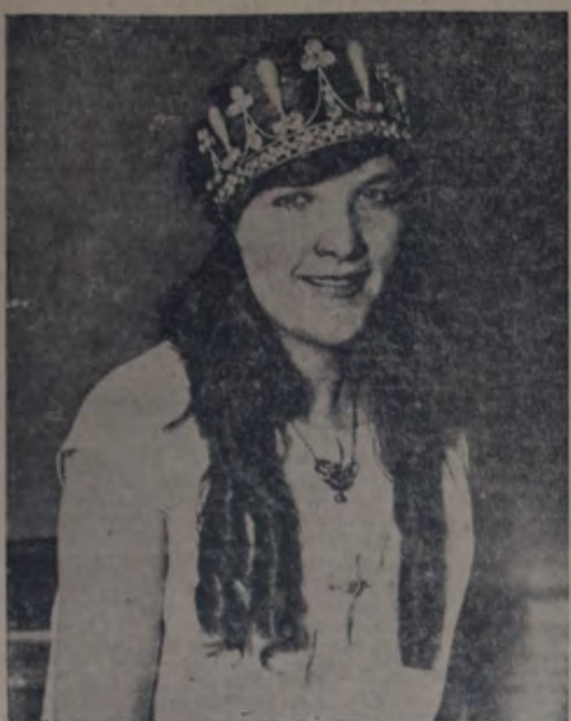
UNA REINA BEST, QUE HA SIDO ELEGIDA REINA DE LOS TRABAJADORES ferroviarios ingleses y que ha sido objeto de grandes agasajos en Londres