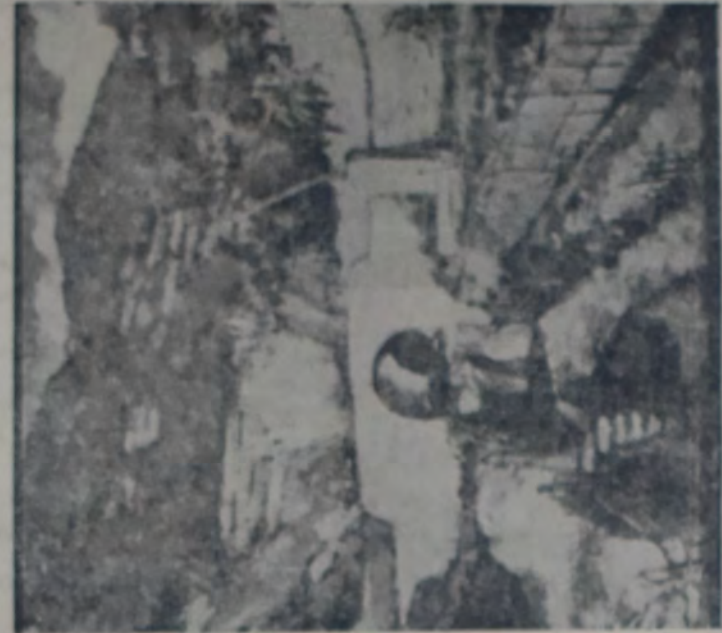
"VIEJO PUENTE DE CERVO"

Es evidente que este mismo fenómeno no puede atribuirse a los arreates arenosos de los vientos violentos por la parte alta de la atmósfera. — M. D.