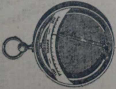
Barómetro médico aneróide, de Vidi.

A principios del siglo XVIII, el duque de Toscana mandó cavar un pozo profundo. Terminada la obra, observó con considerable sorpresa que el agua que pesa un poco, se elevaba más que el agua que pesa un poco más. El agua que pesa un poco más se elevaba más que el agua que pesa un poco menos. Este fenómeno se llama presión atmosférica. El agua que pesa un poco más se eleva más que el agua que pesa un poco menos.