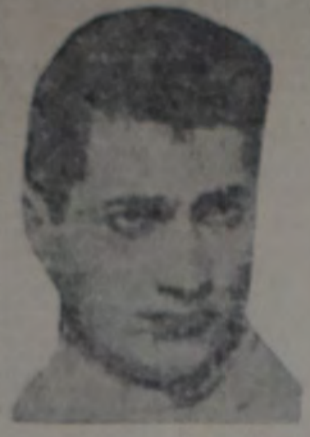
EL GUARDAVALLA OLIMPIO argentino que reaparecerá hoy defendiendo los colores de la Asociación frente al equipo brasileño.

A la presentación del equipo campeón brasileño América F. C., que se hará hoy en Avellaneda, se enfrentará a un combinado de la Asociación Amateurs Argentina, en el programa futbolístico de hoy, otros partidos amistosos se jugarán en Lanús.