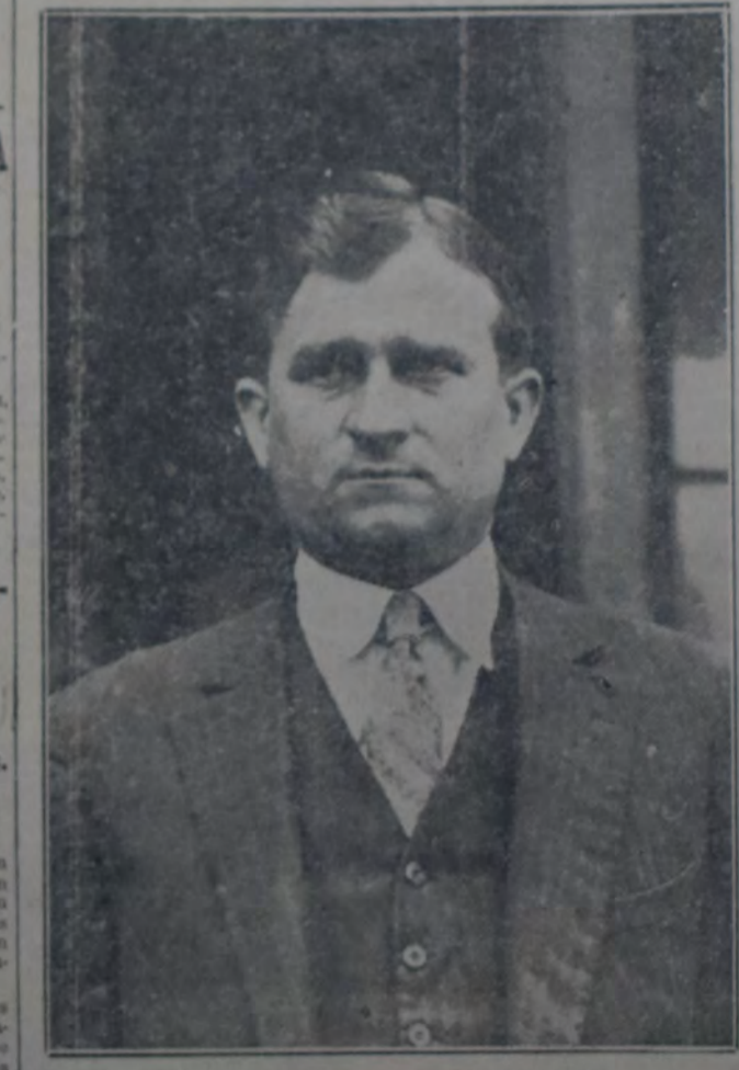
QUE HOY TENDRA A SU CARGO EL CONTROL DEL INTERESANTE encuentro internacional que se verificará en la cancha del club Independiente en Avellaneda.

Se apreciará en la cancha con mayores elementos de juicio.