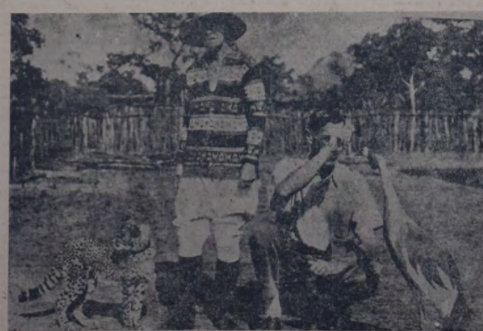
UN MATRIMONIO INGLÉS RESIDENTE EN EL CONGO BELGA ACOMPAÑADO DE LOS ANIMALES SALVAJES que han domesticado y con los cuales conviven.