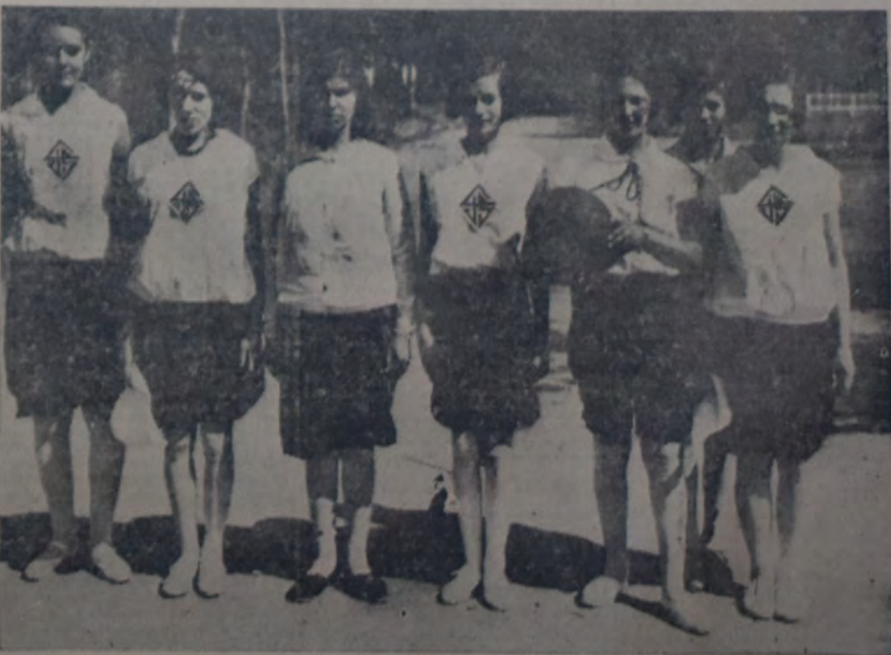
TAMBIEN LAS MUJERES SOCIALISTAS DE LA ARGENTINA TRATAN DE VINCULAR SUS ACTIVIDADES con el deporte...